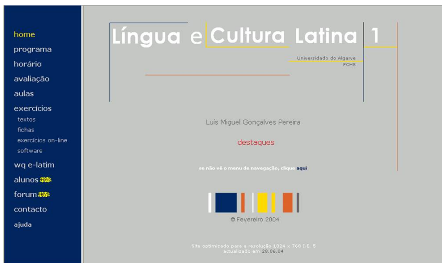
Fig. 1. Homepage do website da disciplina de Língua e Cultura Latina I. Do lado esquerdo encontra-se o Menu. No centro está a ligação para Destaques e, em baixo, a data da última actualização.

http://w3.ualg.pt/~Impereira/lcl3 - Língua e Cultura Latina III (Fig.2)